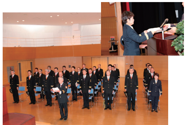
卒業式・卒業証書授与