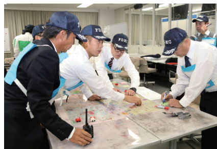
指揮シミュレーション訓練

今後は本コースで獲得した知識や思いを糧に、消防団活性化のための業務に積極的に取り組んでいただくことを期待しています。