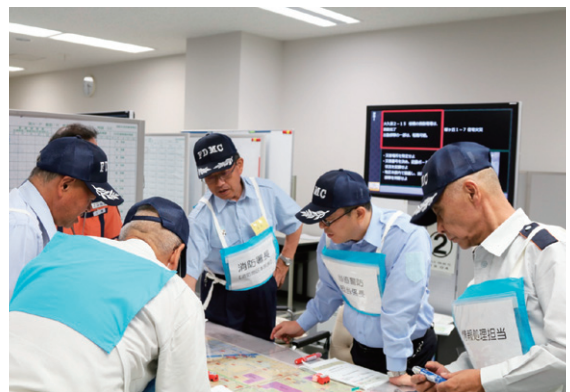
指揮シミュレーション訓練の様子