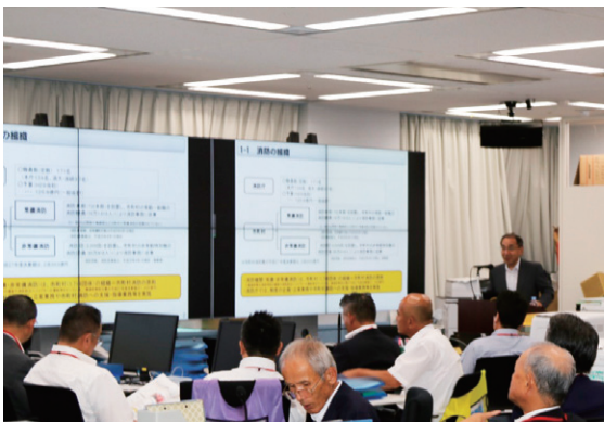
稲山消防庁長官による講話