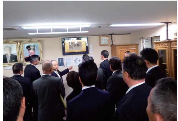
秋本日本消防協会会長による会長室での説明

今後、消防大学校で修得した知識・技術・情熱をそれぞれの地域で発揮され、地域住民の負託に応えるとともに、消防団の発展に向けて大いに活躍されることを期待しています。